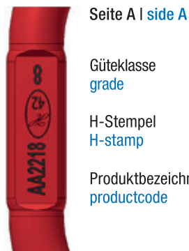
Seite A | side A