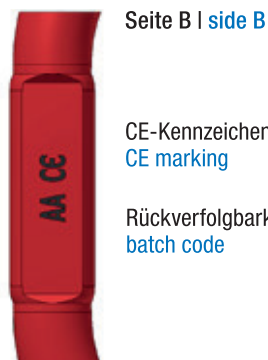
Seite B | side B