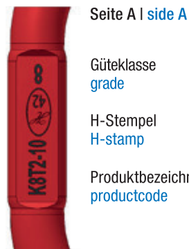
Seite A | side A