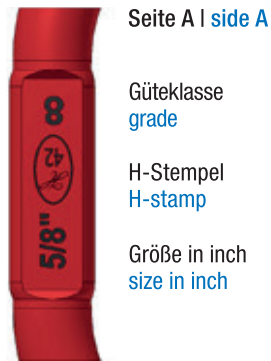
Seite A | side A