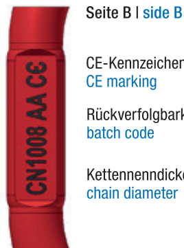
Seite B | side B